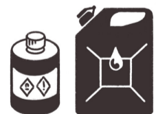
Nicht erlaubte Anzünd- hilfen (z.B. Benzin, Lösungsmittel)