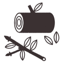
Nicht vollständig durch- getrocknetes oder nasses Holz