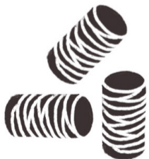
Gängige Anzündhilfen (z.B. Holzwolle)