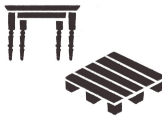
Behandeltes Holz, Altholz (z.B. Paletten, Möbel)